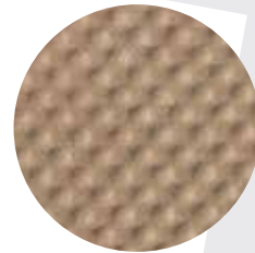
エンボス加工を施した普及タイプ